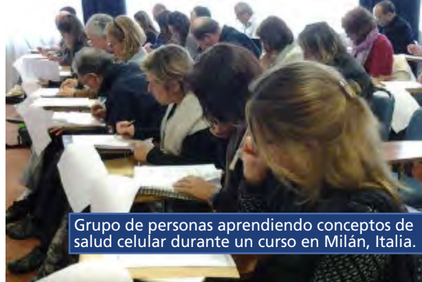
Grupo de personas aprendiendo conceptos de salud celular durante un curso en Milán, Italia.

La Declaración de Barletta Barletta, Italia, 19 de Octubre del 2014