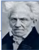
Arthur Schopenhauer Filósofo alemán (1788 – 1860)

"Toda verdad atraviesa tres fases: Primero, es ridiculizada. Segundo, recibe violenta oposición. Tercero, es aceptada como algo evidente".