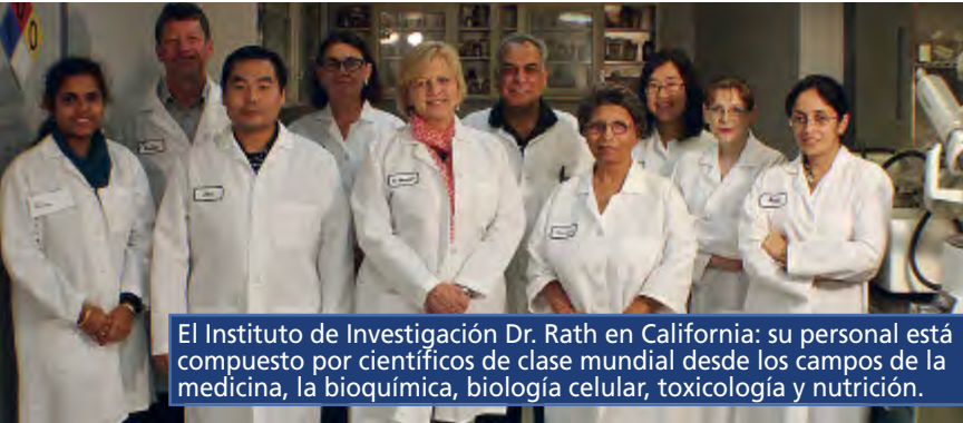
El Instituto de Investigación Dr. Rath en California: su personal está compuesto por científicos de clase mundial desde los campos de la medicina, la bioquímica, biología celular, toxicología y nutrición.

La Salud Natural Preventiva debe ser un derecho humano