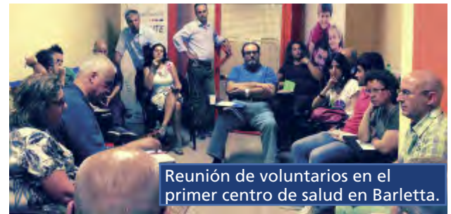
Reunión de voluntarios en el primer centro de salud en Barletta.

La Declaración de Barletta Barletta, Italia, 19 de Octubre del 2014